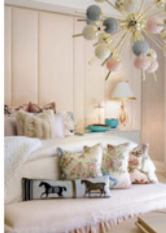
Mobilier, suspension lumineuse et accessoires | Les Morris Design | Coussin à motif de Chevalier Tard

La deuxième chambre d'amis, plus discrète, joue la carte de la fraîcheur avec son mur bleu-vert pâle et son canapé peint légèrement jauni. Le litonne s'ajoute aux notes roses et apporte une touche subtile. Et encore, le designer aime créer la surprise avec des luminaires accrochés au plafond, qui s'éclaircissent légèrement les soirées.