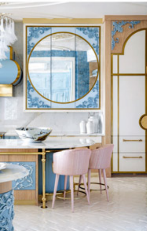
Repos et accessoires : un Home Design Catherine Dreyer - cuisine et Placards Blue (autour de la table ronde) : Louis XV

Arabesques, feuilles d'acanthé et volutes deviennent la cuisine telle de la dentelle.