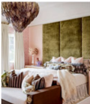
Mobilier et accessoires | Les Morris Design

Les deuxes d'art occupent une place importante dans les aménagements signés par Morris, aussi bien dans les palais à côté que dans les chambres. Souvent utilisées comme séparateurs, elles permettent d'ajouter une nouvelle dimension au décor, comme c'est le cas dans cette chambre d'amis qui combine du rose tendre à un vert saumon. Si la maîtresse dormira dans la pièce grâce à un canapé, une table et une table de chevet simples, le designer a pris soin d'y saupoudrer quelques éléments classiques, notamment le loftin, le papier peint à médaillons et le coussin au pied de lit.